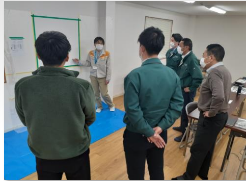
②施工部の壁にテーピング