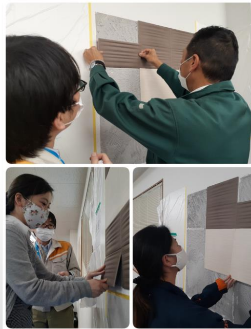
⑤次にパネルを張るだけ！