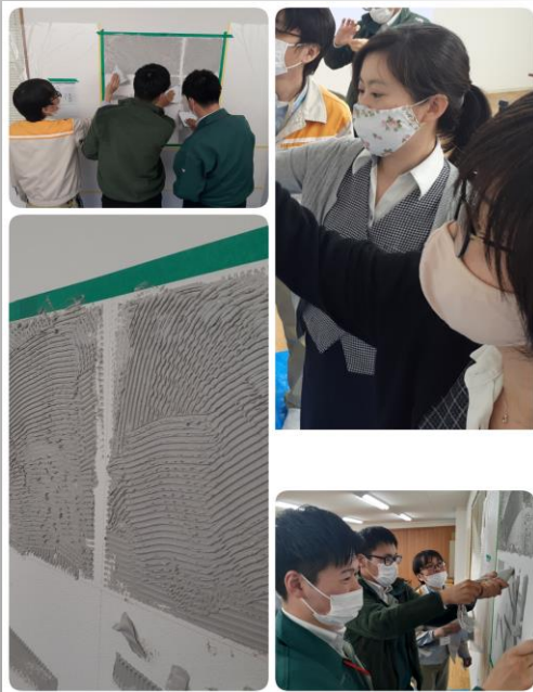
④付属のヘラで伸ばします。女性でも簡単！