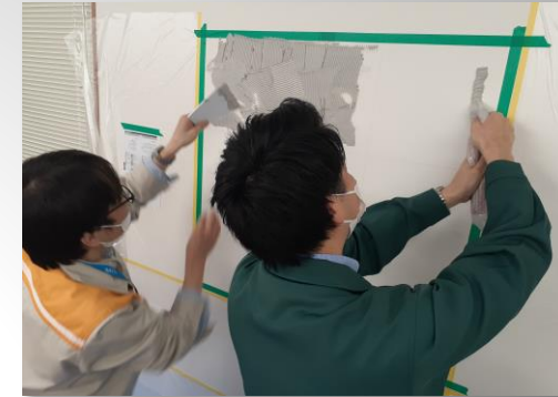
③直接、壁に付属の接着剤を塗る。